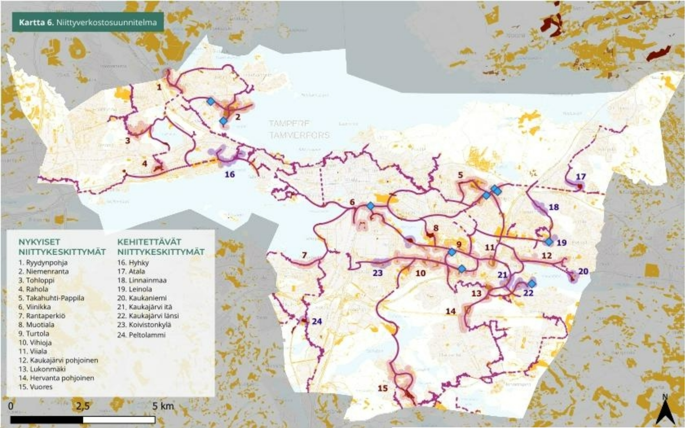
Kartta 6. Niittyverkostosuunnitelma